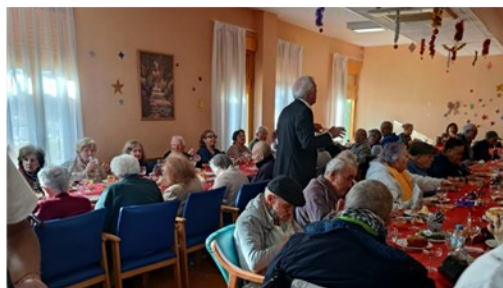
COMIDA RESIDENCIA HONTANAR