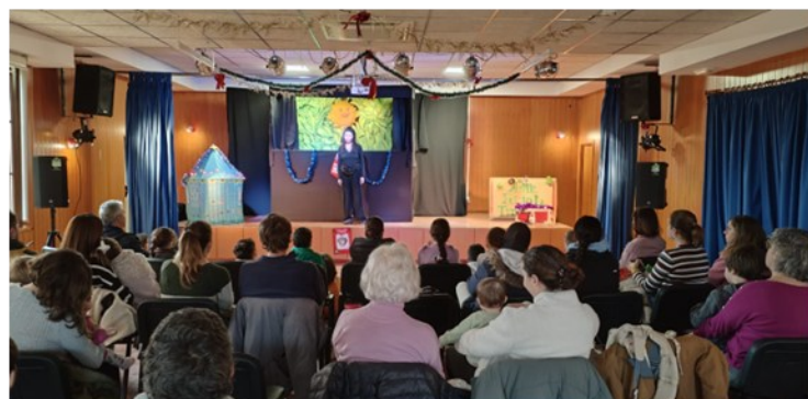
CUENTA CUENTOS UNA HISTORIA DE NAVIDAD