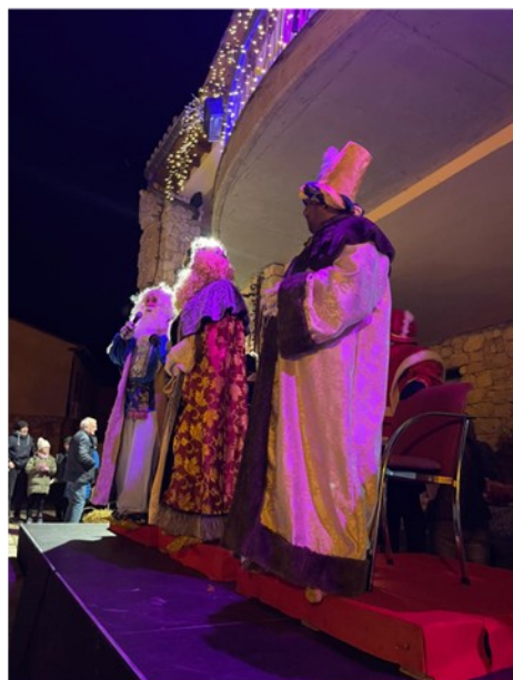
CABALGATA DE REYES