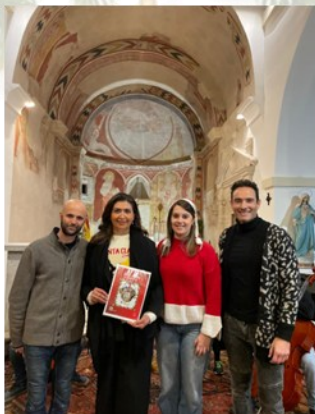
CONCIERTO DE NAVIDAD EMMT