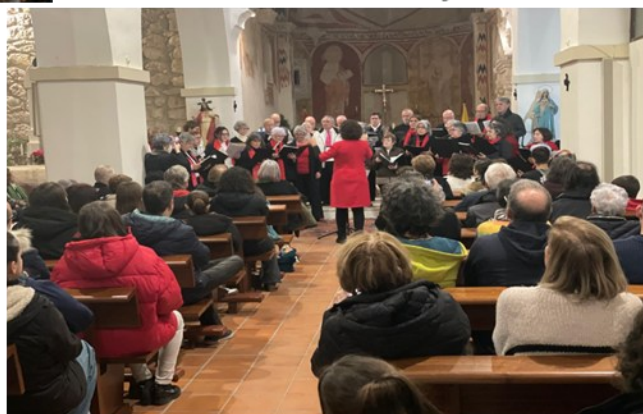
CORO VOCES DEL JARAMA