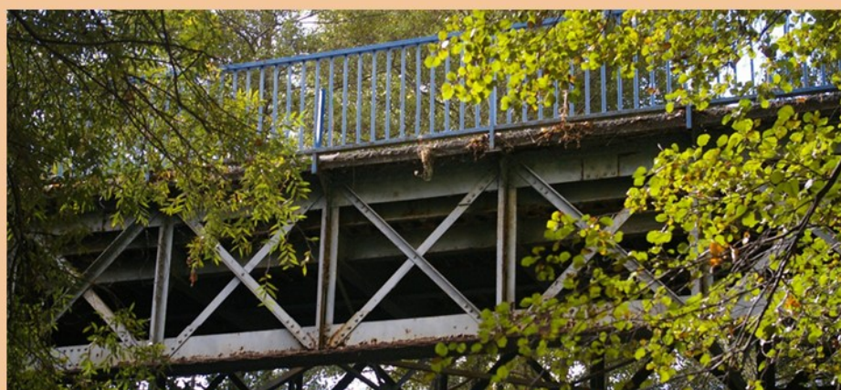
Detalle de la estructura de acero, cuyo origen ya podemos situar en 1916.