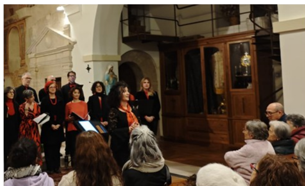
CORO GOSPEL MOLOTOFF