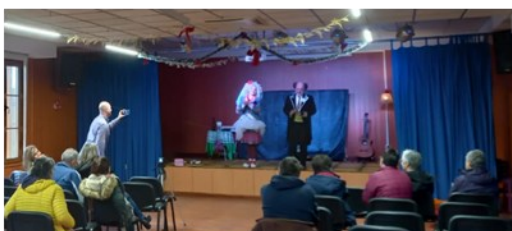
TEATRO: NAVIDAD CON RAMÓN Y RAMONA.