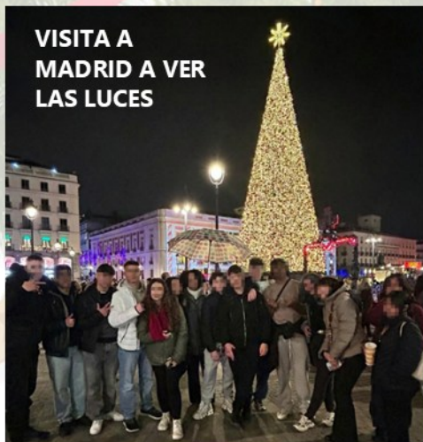
VISITA A MADRID A VER LAS LUCES