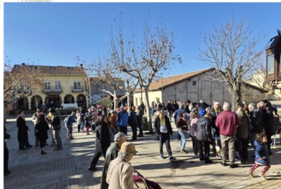
PREUVAS, Uvas, cava, música y sorteo.