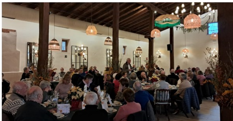
COMIDA DE MAYORES