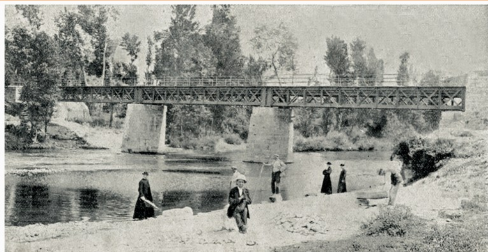
INAUGURACION DE UN PUENTE EN MADRID EL NUEVO PUENTE SOBRE EL JARAMA, CONSTRUIDO POR LA DIPUTACION PROVINCIAL DE MADRID

Con el pie de foto original que vemos, así se publicó en la revista Blanco y Negro esta interesante fotografía donde “el puente inaugurado en Madrid” no es otro que el de la Charcueta, conocido a partir de entonces también como Puente de Hierro.