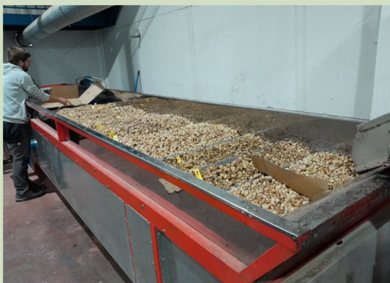
Procesado pistachos de Torremocha de Jarama en las instalaciones del IMIDRA