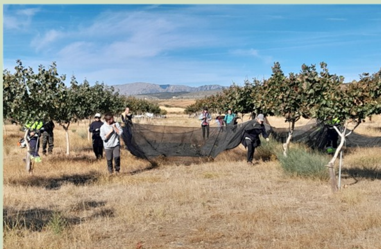
Recogida de pistachos en la parcela de Torremocha de Jarama