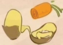
Restos de verduras