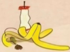
Restos de fruta