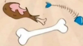
Restos de pescado, de carne y huesos