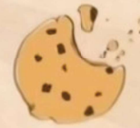
Restos de comida