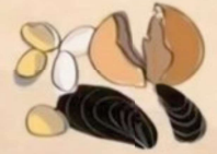
Cáscaras (huevos, frutos secos y mariscos)